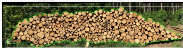
Abb. 1: Berechnung als Industrieholz

Um das Bild zu referenzieren, muss die maximale Holzpolterbreite mit einem Handbandmaß zentimetergenau gemessen werden. Die gemessene Breite wird in der Berechnungsapp eingetragen.