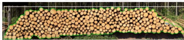
Abb. 2: Berechnung mit Einzelstammerkennung