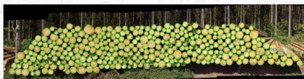
Abb. 3: Stückzahlerkennung vollflächige Stirnflächenkreuzkluppung

Die Breitenmessung darf max. 0,5% abweichen, da sonst die angestrebte Standardabweichung von 2,5% pro Polter und 0,9% über mehrere Polter nicht erreicht werden kann.